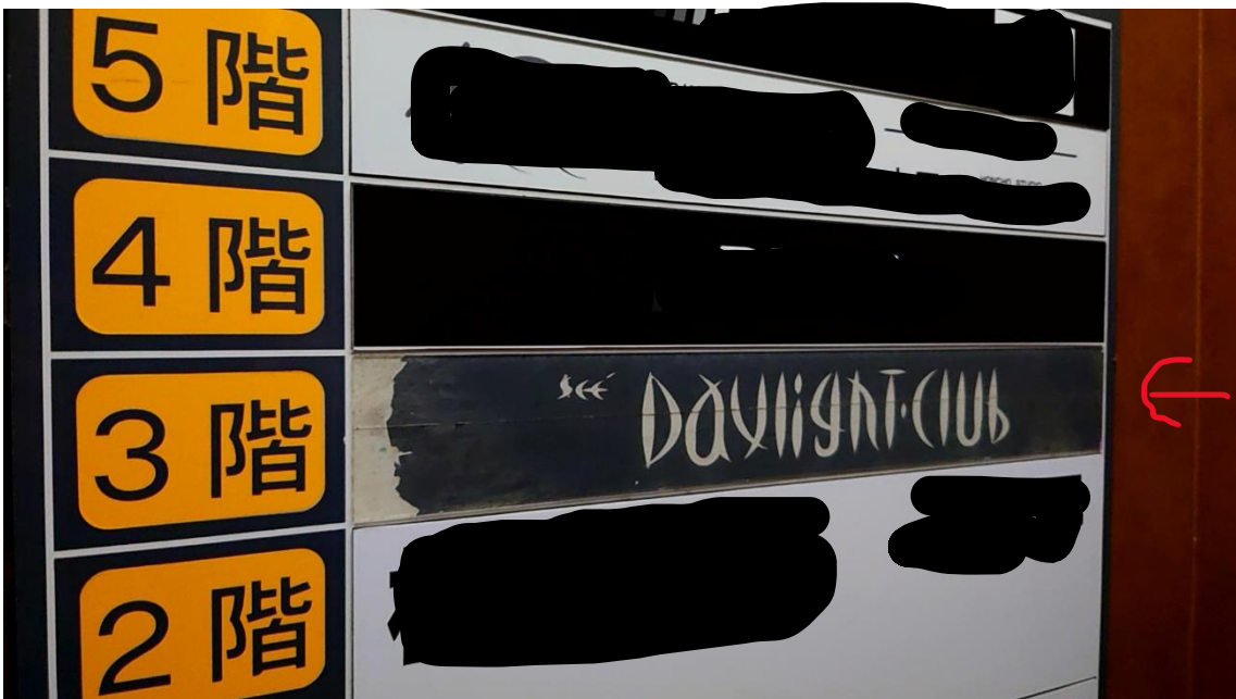
エレベーター内の階層表示は剥がされた痕跡がありました。 (他の階の表示を加工してあります)