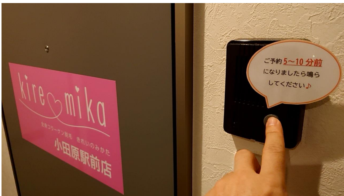
インターホンの反応はありませんでした。