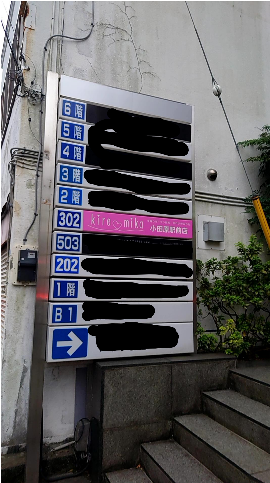
テナントビル入口の表示は残っています（加工済み）