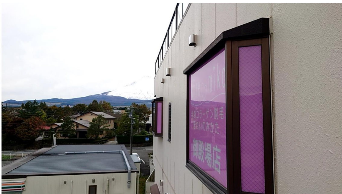
店舗がある階から見た状況。表示類は残ったままです。