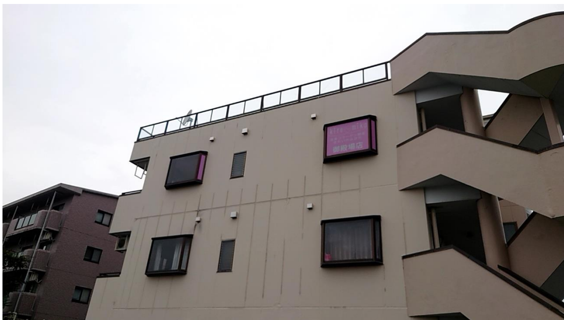
店舗ビル横からの全景